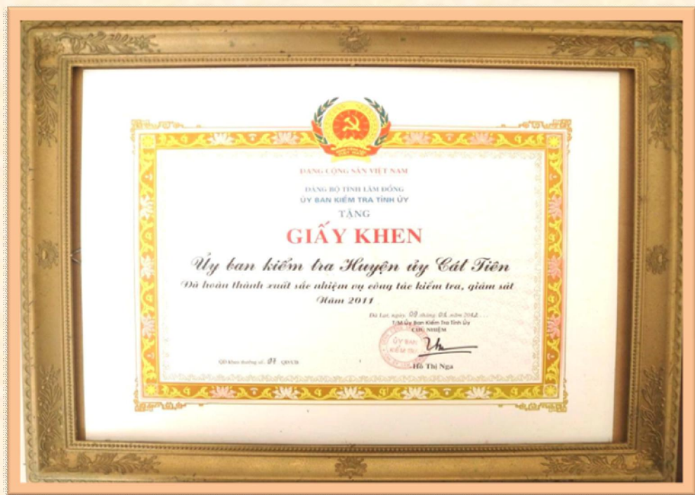
Giấy khen của UBKT Tỉnh ủy năm 2011, tại Quyết định số 97-QĐ-UBKTTU, ngày 09/01/2012