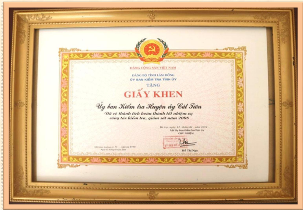
Giấy khen của UBKT Tỉnh ủy năm 2008, tại Quyết định số 52-QĐ-UBKTTU, ngày 12/01/2009